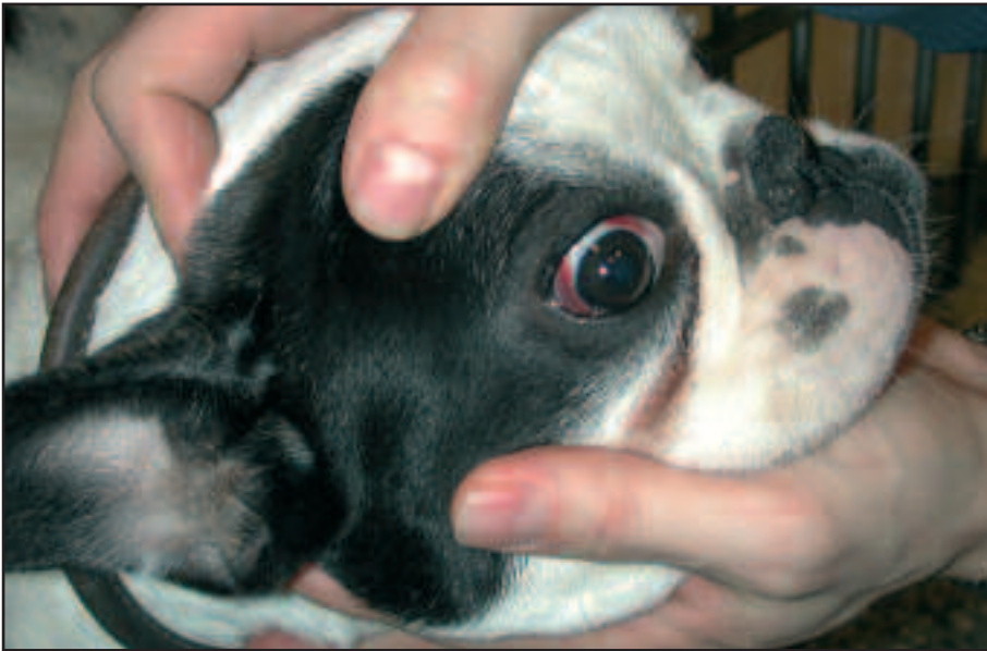
Figur 5. Blødninger i øjet forårsaget af infektion med fransk hjerteorm

Da følgerne af infektionen forværres over tid, er det vigtigt at opdage infektionen tidligt. Dette kan gøres på 2 måder. Enten ved at være opmærksom på symptomer eller ved rutinemæssige undersøgelser. Dyr lægen vil kunne oplyse om sygdommen er meget udbredt i det område, hvor man bor eller færdes. Hvis det er tilfældet, bør man overveje at få undersøgt af føring fra sin hund 1-2 gange om året måske samtidigt med vaccination eller almindeligt sundhedstjek.