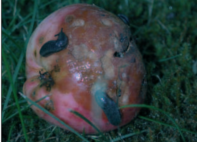
Figur 2. Nøgensnegle ca. 2-1 cm lange indtager et æble.

små snegle på godt 1 cm. (figur 2) til store skovsnegle, der kan blive op til 15 cm. lange. Snegle, der lever af græs, blade, frugter mv. kommer ikke så ofte i kontakt med afføring fra hund/ræv og er derfor ikke så vigtige for smittetransmissionen som de arter, som aktivt opsøger afføring som fødekilde (figur 3). Når larver trænger ind i sneglen fortsætter udviklingen fra 1. til 3. larvestadie. Denne periode varer ca. 2-3 uger, hvorefter larven er klar til at inficere en ny slutvært. Hunden smittes ved at spise en inficeret snegl – helt eller delvis. Det er heldigvis de færreste hunde, der bevidst spiser snegle, men mange får dem i munden under leg eller ved at spise græs, blade, nedfalden æbler eller lignende (figur 2). Når larverne (L3-stadiet) kommer ned i mavesækken bevæger de sig gennem tarmvæg og via blodkar op til hjertet og lunger, hvor de videreudvikler sig til voksenstadiet.