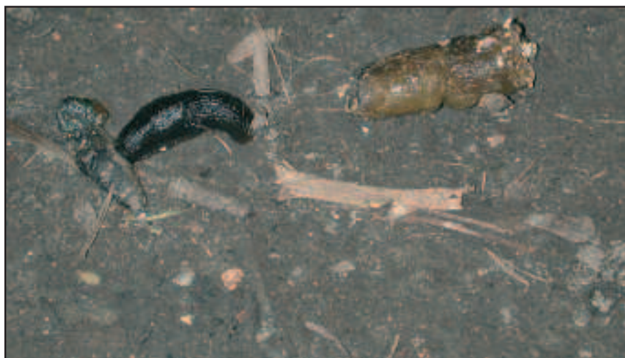
Figur 3. Sort skovsnegl indtager et måltid med 1. stadie larver

striktioner på sin hunds naturlige adfærd, medmindre den ligefrem æder snegle konstant eller har haft gentagne alvorlige infektioner med hjerteorm.